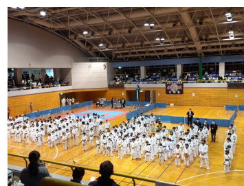
花元先生が主催している空手の大会の様子

教会では金曜日の午後5時半より（都度調整あり）空手の稽古をしています。ご関心がありましたら遠慮なくお問い合わせください。